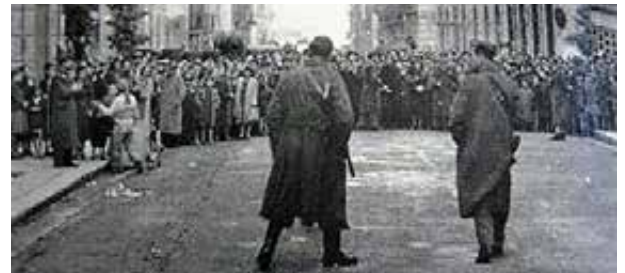
Militari delle Divisioni S.I. che controllano una manifestazione in Sicilia