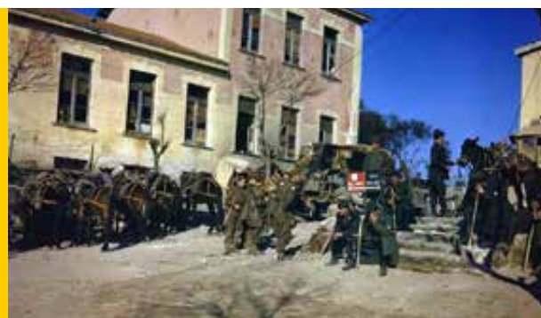
Gennaio 1944, salmerie italiane aggregate all'8ª Armata inglese sul fronte del Garigliano