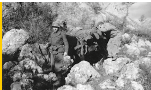
Dicembre 1943 trasporto di un caduto