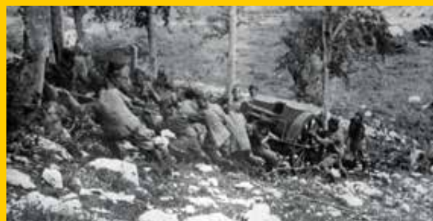
Messa in batteria di un pezzo da campagna

Figlio unico di Alessandro Casati, uomo politico liberale, antifascista, all'epoca ministro della guerra. Il giovane ufficiale, classe 1918, che proveniva dai granatieri di Sardegna, dopo l'8 settembre 1943 volle continuare la guerra contro i tedeschi e fu assegnato al battaglione "Bafile" del reggimento di marina "San Marco". Cadde eroicamente a Corinaldo (Ancona) il 6 agosto 1944 e gli fu conferita la Medaglia d'Oro al Valor Militare alla memoria.