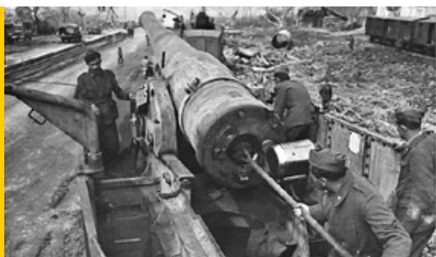
La 255° batteria ferroviaria in azione pulizia della canna