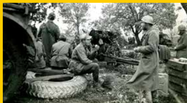
Monte Lungo, artiglieri