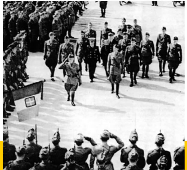
Brindisi settembre 1943 Il Re passa in rivista un reparto