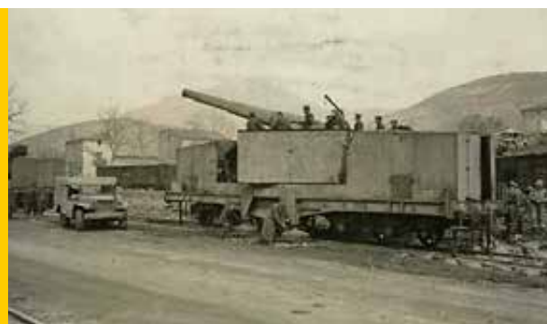
La 255° batteria ferroviaria in azione