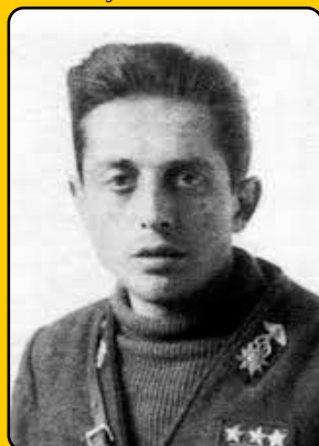
Capitano Filippo Beltrami Medaglia d'Oro al Valor Militare