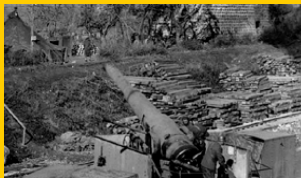
La 255° batteria ferroviaria in azione, pronti al fuoco