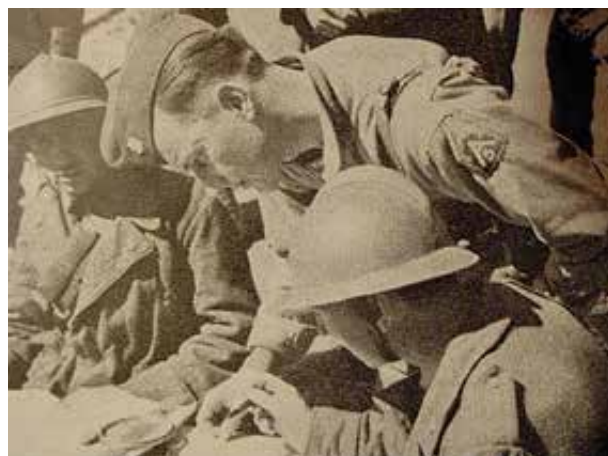
La 255° batteria ferroviaria in azione, calcolo dei tiri

Entrò in azione alle dipendenze della 5ª Armata americana l'8 marzo 1944 durante la battaglia di Montecassino, sparando dalla stazione ferroviaria di Mignano Montelungo fino all'esaurimento delle munizioni, il pezzo aveva una gittata massima di circa 18 km.