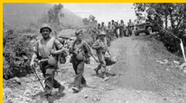
Maggio 1944, fanti della 210ª divisione di Fanteria in marcia verso la testa di ponte di Anzio aggregati alla 5ª Armata americana