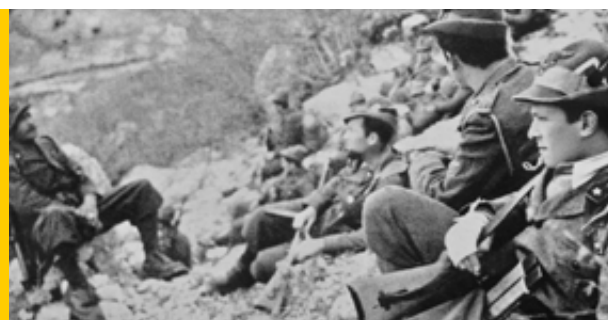
Battaglione "Piemonte", Alpini in attesa della battaglia