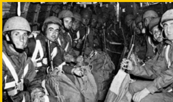
Paracadutisti italiani verso la zona di lancio dell'operazione Herring