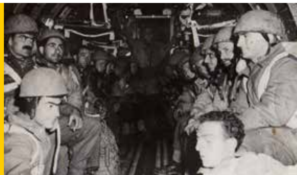
Paracadutisti italiani verso la zona di lancio dell'operazione Herring