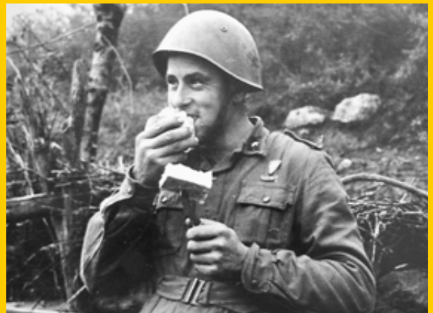
Un soldato italiano in un momento di riposo

Al comando del 1° Raggruppamento il 16 dicembre 1943 partecipò alla battaglia di Montelungo, dove le truppe italiana diedero prova di grande valore, al prezzo di dure perdite. L'11 gennaio 1944 lasciò il comando al Generale Umberto Utili. Vincenzo Dapino fu nominato Cavaliere dell'Ordine militare di Savoia e nel 1952 venne promosso tenente generale nella riserva militare. Morì nel luglio 1957.