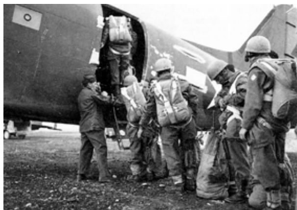
Paracadutisti italiani salgono a bordo di un C-47 all'aeroporto di Rosignano (20 aprile 1945)

Nonostante le difficoltà incontrate nei lanci i paracadutisti in tre giorni di aspri combattimenti portarono a termine la loro missione catturando 2000 nemici, attaccando colonne tedesche, minando 7 strade di grande traffico, distruggendo 77 linee telefoniche, salvando alcuni ponti utili agli alleati e comportando soprattutto grande panico nelle retrovie del nemico. Le perdite totali tra le pattuglie dello Squadrone F ammontarono a 21 caduti, 14 feriti e 10 dispersi.