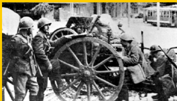
Roma artiglieria 8 settembre