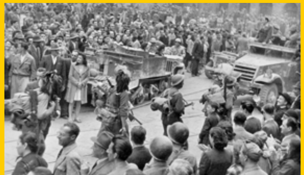
Bologna - 21 aprile 1945, l'ingresso dei Bersaglieri del battaglione Goito