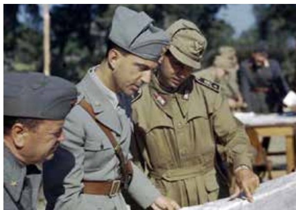
26 Maggio 1944, Presenzano (Caserta), il Principe di Piemonte in visita alla 210a divisione di Fanteria

L'impiego fu intenso e vario: guardia ai depositi, polizia militare, controllo del traffico, scorta a convogli ferroviari ed automobilistici, lavorazioni d'officina, rifornimenti alle prime linee e nelle retrovie (salmerie ed autotrasporti), costruzione e riattamento di ponti stradali e ferroviari, realizzazione di oleodotti, costruzione e manutenzione di linee telefoniche, bonifica di campi minati, sistemazione d'impianti idrici ed elettrici, manovalanza per carico e scarico di piroscafi, treni ed aerei, costruzione di piste in aeroporti, lavori di mascheramento, sgombero feriti. L'opera delle Divisioni Ausiliarie fu oscura ma intensa e preziosa, ad esempio i genieri resero inoffensive oltre 500.000 mine, man mano che il fronte si spostava verso nord. Nel 1945 le Divisioni Ausiliarie in totale arrivarono a 196.000 uomini, pari a circa il 25% degli effettivi del XV Gruppo di Armate. Al completo delle forze l'Esercito Cobelligerante Italiano era pari a un ottavo della forza combattente e a un quarto dell'intera forza del XV gruppo d'armate alleato.