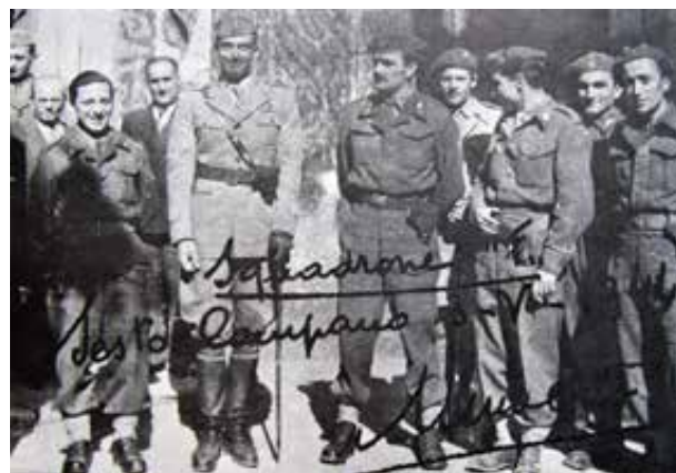
Sesto Campano (Isernia), 3 maggio 1944, il capitano Gay comandante dello Squadrone F con il Principe Umberto

Il 1° squadrone da ricognizione "Folgore" risultò essere una delle unità maggiormente decorate dell'Esercito Italiano. Sul totale di circa trecento militari, furono concesse 3 medaglie d'oro al valor militare, 100 medaglie d'argento, 25 medaglie di bronzo, 66 croci al merito e 4 promozioni per merito di guerra. Le tradizioni dello squadrone sono oggi custodite dal 185° Reggimento paracadutisti ricognizione acquisizione obiettivi "Folgore".