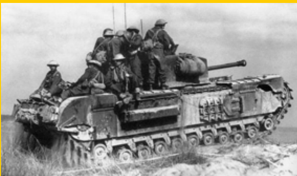
marzo 1945, Castel Borsetti, fanti del 21° reggimento Fanteria, a bordo di un carro Churchill del reggimento North Irish Horse.