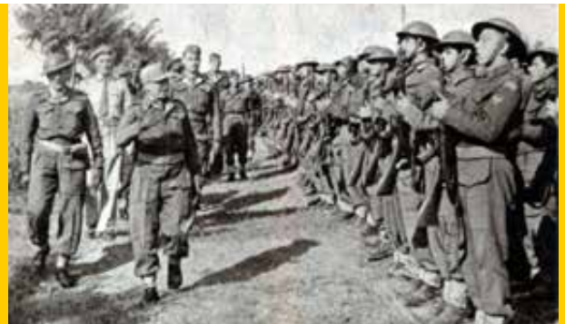
Il generale Arturo Scattini passa in rivista il reparto