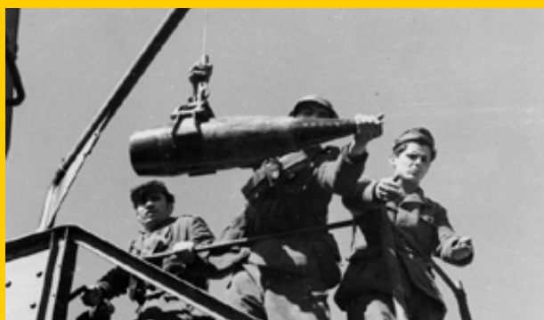
La 255° batteria ferroviaria in azione caricamento