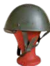
Elmetto da paracadutista M 42