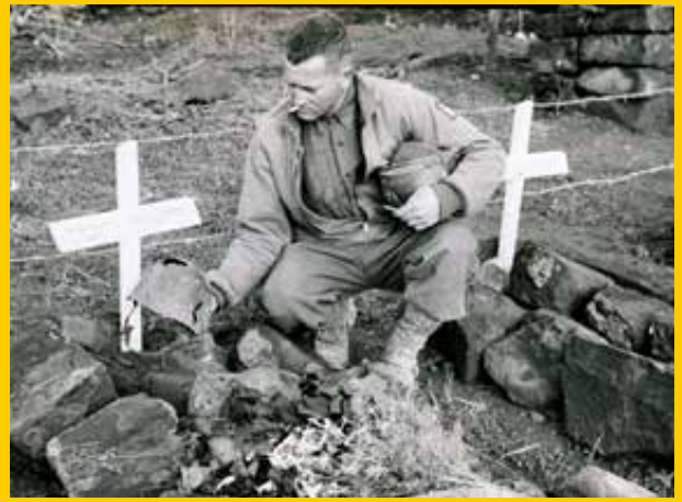
Un militare americano sulla tomba di uno dei caduti italiani a Montelungo