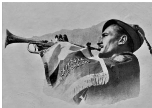
Trombettiere del 5° gruppo salmerie da combattimento Montecassino