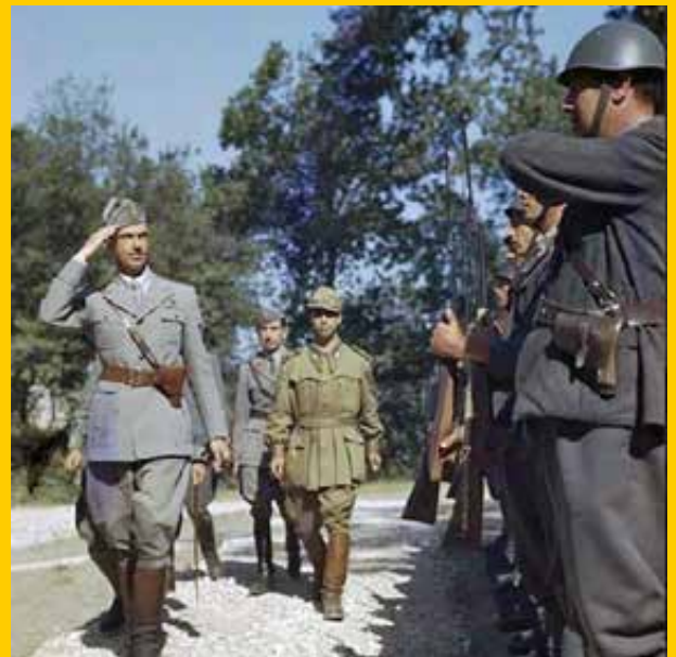
1943 il Luogotenente Umberto di Savoia passa in rassegna un reparto