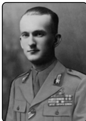
Colonnello Giuseppe Cordero Lanza di Montezemolo Medaglia d'Oro al Valor Militare

L'apporto degli uomini delle forze armate nelle formazioni del Corpo Volontari della Libertà fu di estrema importanza e numericamente considerevole sia nella partecipazione alla lotta delle bande armate, sia nell'organizzazione delle missioni.