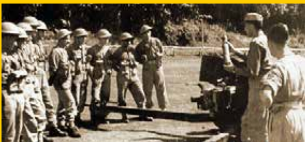
Gruppo combattimento Piceno in addestramento

stanziata in Puglia, nella zona tra Francavilla Fontana Villa Castelli Oria e Grottaglie, inserita nel IX Corpo d'Armata. Era al comando del generale Emanuele Beraudo di Pralormo, seguito poi dal gen. Enzo Vagni. Fu costituito il 10 ottobre 1944 per trasformazione dei reparti della divisione "Piceno". Inquadra il 235° e il 236° Reggimento fanteria, il 152° Reggimento artiglieria, il CLII battaglione misto genio, due sezioni di Carabinieri Reali, ed i servizi divisionali. Durante il periodo di addestramento parte delle forze fu utilizzata per servizi di ordine pubblico e 1400 uomini furono destinati alle unità di salmerie a disposizione delle forze alleate. Il Gruppo quindi fu orientato prima ad un impiego logistico, nel gennaio del 1945, gli fu affidato il compito dell'addestramento dei complementi. Fu quindi denominato Comando divisione "Piceno", Centro addestramento complementi per forze italiane di combattimento. L'ordinamento fu modificato, si ebbe un Comando Centro, un reggimento raccolta e smistamento complementi, un reggimento complementi di fanteria, un reggimento complementi misto, scuole di addestramento. Nei restanti mesi il Centro assolse la funzione addestrativa, fornendo ai Gruppi in linea personale ben preparato. Il Centro aveva sede a Bracciano e Cesano di Roma in caserme ed aree addestrative ancora oggi destinate a tale funzione.