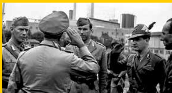
Roma - Ufficiali della Div. Sassari trattano con i tedeschi la fine degli scontri a Porta San Paolo (10 settembre 1943)