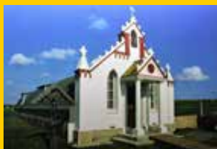
La Chiesetta di Lambholm (Isole Orcadi Scozia), conosciuta come La Cappella Italiana residuo del Campo 60 dei prigionieri italiani