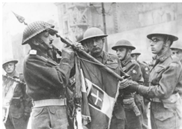
Torino, piazza Castello, 4 novembre 1945, consegna della Medaglia di Bronzo al Valor Militare allo standardo del 7° reggimento artiglieria Cremona

Copyright 2022 ANARTI Sezione Provinciale di Torino Tutti i diritti sono riservati.