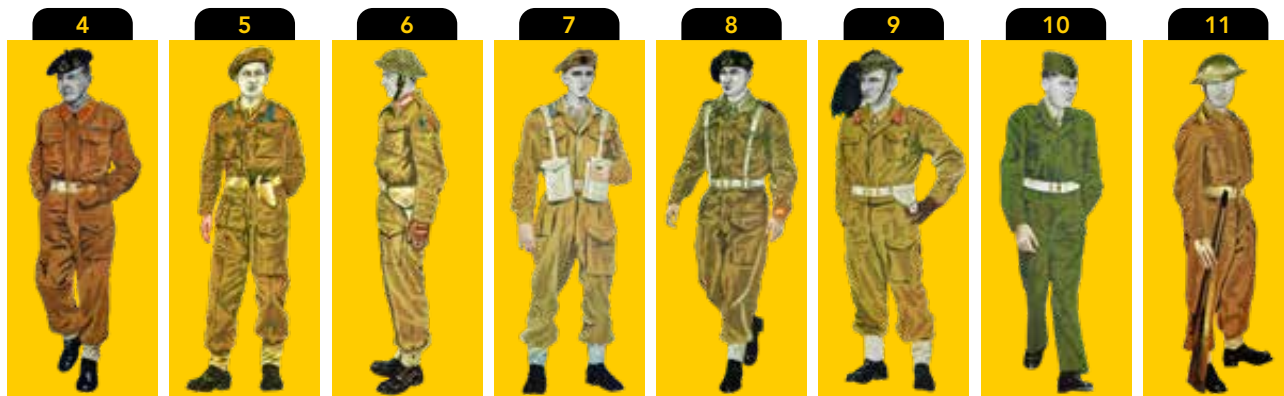
(I figurini sono tratti dall'opera di E. e V. Del Giudice, Uniformi Militari Italiane, Voll. II, Milano, 1968)