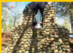
Pilone Votivo costruito dagli Italiani a Camp Myles Standish nel Massachusetts (USA)