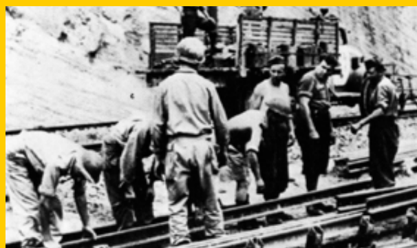
Genieri italiani, americani e inglesi al lavoro lungo una ferrovia