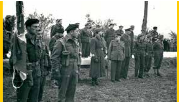
Consegna della bandiera al battaglione San Marco