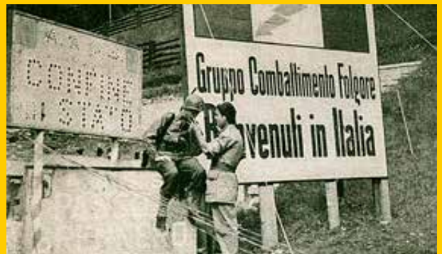
Al termine del conflitto, il Gruppo di combattimento Folgore a presidio del Brennero in Alto Adige