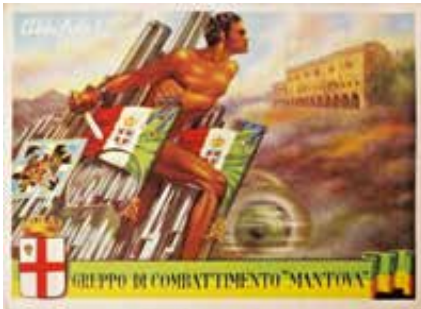
Cartolina del gruppo Mantova

Il gruppo nasce dalla divisione "Mantova" stanziata in Calabria, alle dipendenze della VII Armata nel settembre 1943. Era al comando del generale Guido Bologna. Inquadra il 76° ed il 114° Reggimento fanteria, il 155° Reggimento artiglieria, il CIV battaglione misto genio, due sezioni di Carabinieri Reali, ed i servizi divisionali. Dopo la costituzione e l'addestramento svolto in Calabria, a fine novembre ed inizio 1944 si trasferì nel Sannio, dove continuò l'attività addestrativa. Nella seconda metà di aprile 1944 si trasferì in Toscana nella zona del Chianti. Doveva entrare in linea a partire dal 25 aprile 1945 alle dipendenze della VIII Armata Britannica. Il Gruppo "Mantova" non partecipò a combattimenti a causa della fine della guerra in Italia il 2 maggio 1945. Il contributo del Gruppo di Combattimento "Mantova", fu sia di lavoro, vigilanza e sicurezza, sia come forza di riserva, pronta ad intervenire secondo le necessità della battaglia finale che era in corso.