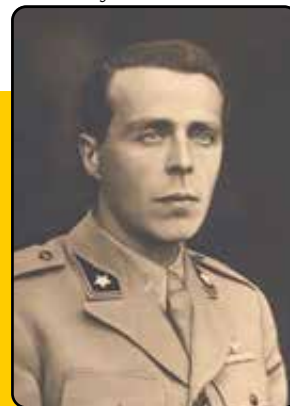
Capitano Franco Balbis Medaglia d'Oro al Valor Militare