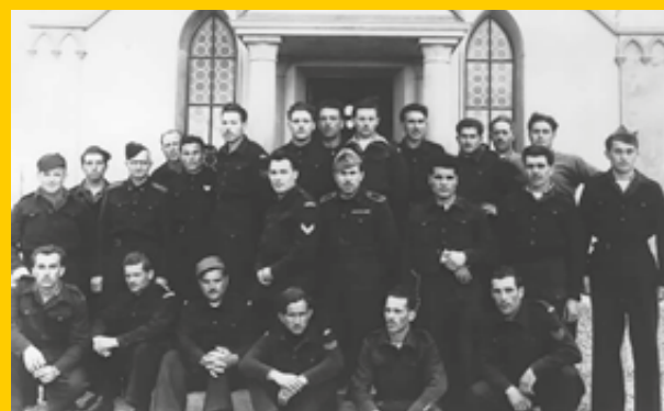
Gran Bretagna - Gruppo di prigionieri italiani