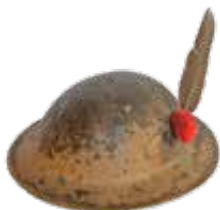
Elmetto alpini - Elmetto MK II di costruzione sudafricana in dotazione ai Gruppi di Combattimento con fregio e penna da Alpino, che gli Alpini rifiutarono di portare.