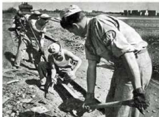
Stati Uniti - Italian Service Units - Lavori stradali