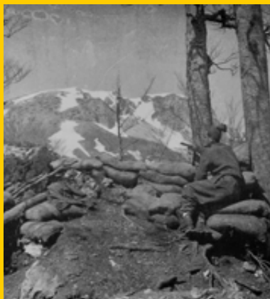
Battaglione "Piemonte", postazione su Monte Marrone. (G. Donati)