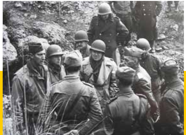
Secondo da sinistra, il gen Mark Clark, Comandante della 5a Armata statunitense, conversa con il gen Vincenzo Dapino, Comandante del 1° Raggruppamento motorizzato

fu inviato (gen. 1943) in Tunisia per assumere il comando della 1a armata, alla testa della quale si distinse in modo particolare sulle linee del Mareth e dell'Akarit, protraendo poi la resistenza nella Tunisia settentrionale. Fatto prigioniero dagli Anglo-Americani, fu contemporaneamente nominato maresciallo d'Italia e, al suo rimpatrio, dopo l'8 sett. 1943, il Re lo nominò capo di stato maggiore generale del nuovo esercito, contro l'aperta ostilità di Badoglio. conservò la carica fino al 1945. Collocato nella riserva il 27 marzo 1947, nel 1953 fu eletto Senatore della Repubblica, morì a Roma il 18 dicembre 1968.