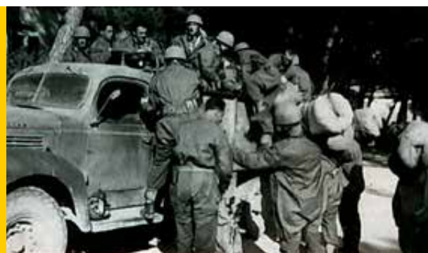
Paracadutisti della Nembo salgono sul un autocarro