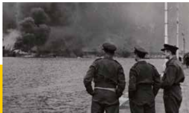
2 dicembre 1943 - bombardamento del porto di Bari

della precedente inchiesta della Croce Rossa che lo scagionava. Si basarono solo su dichiarazioni contraddittorie, forse per intimidire il governo italiano. Bellomo fu l'unico militare italiano giustiziato per crimini di guerra. Ebbe una parziale riabilitazione postuma, Nel 1951 il governo italiano conferì a Bellomo la medaglia d'argento al valor militare per la difesa di Bari. Nel 1976 le sue spoglie furono traslate, con tutti gli onori, nel sacrario barese dei caduti d'oltremare. Nonostante alcune richieste non c'è stata, invece, alcuna revisione del processo così come il generale aveva richiesto prima di morire. La storia del generale Nicola Bellomo è emblematica della complessa situazione successiva all'8 settembre.