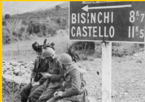
Militari italiani in Corsica