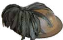
Elmetto bersagliere - Elmetto MK II di costruzione sudafricana in dotazione ai Gruppi di Combattimento con fregio e piumetto dei Bersaglieri.