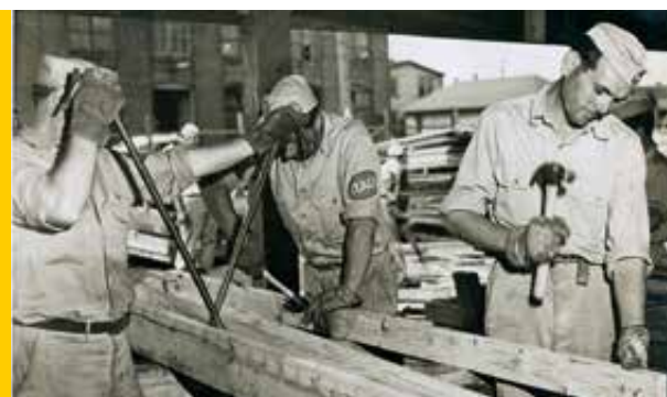
Stati Uniti - Italian Service Units - Laboratorio di falegnameria