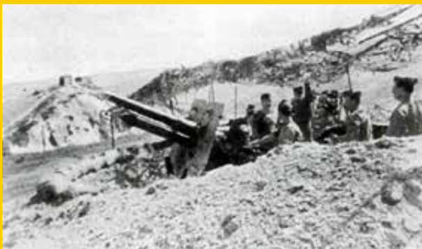
Marzo 1945 Zona del Chianti. Il Gruppo Legnano in fase di addestramento