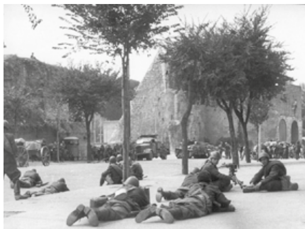
I Granatieri difendono Porta San Paolo

Gli Angloamericani erano già sbarcati in Sicilia da circa due settimane quando Mussolini e il suo regime crollarono il 25 luglio del 1943 sotto i colpi di una operazione condotta dal Re ma alimentata da una fronda interna del fascismo. I venti di cospirazione contro Mussolini spiravano da tempo, ma il Re tergiversava avanzando giustificazioni costituzionali. Vi era ben poco di preciso e strutturato, vi era l'irrazionale e scaramantica attesa dell'occasione migliore. I generali speravano nel Re, il Re nei generali e qualcuno sperava ancora che Mussolini trovasse il coraggio di rompere con i tedeschi. Dal 25 luglio ci vollero sei giorni, prima che si aprissero le trattative con gli anglo-americani. Un negoziato travagliato portò ad un testo di resa preliminare, sottoscritto a Cassibile il 3 settembre, che disponeva la resa incondizionata dell'Italia, riducendo, ma non eliminando, la sovranità del governo italiano. La reazione dell'ex alleato tedesco fu rapida, decisa e brutale. L'8 settembre fu una tragedia nazionale ma anche, e principalmente, un punto di svolta innanzi ad una situazione bellica disastrosa che, per l'Italia, proseguendo invariata, avrebbe portato ad un disastro materiale e istituzionale totale come quello che subirono poi nel 1945 Germania e Giappone.