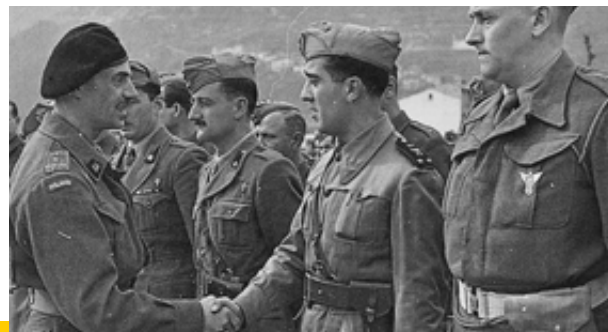
Il generale polacco Anders e ufficiali italiani

misto, 470° ospedale da campo. Le perdite furono, dal settembre al 31 dicembre 1943, 79 caduti, 265 feriti, 166 dispersi; da gennaio al 17 aprile 1944, 14 caduti, 50 feriti, 9 dispersi. Dopo i successi di Monte Lungo e di Monte Marrone gli Alleati autorizzarono la trasformazione del 1° Raggruppamento Motorizzato in una unità più consistente. Il 18 aprile 1944 nasceva il Corpo Italiano di Liberazione (C.I.L.) con una consistenza di 25.000 uomini.