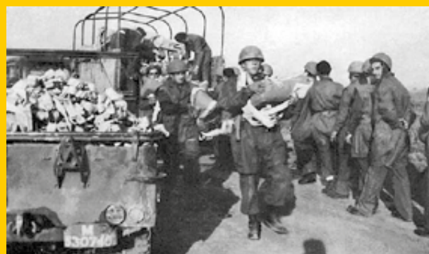
I Parà mentre ritirano i paracadute