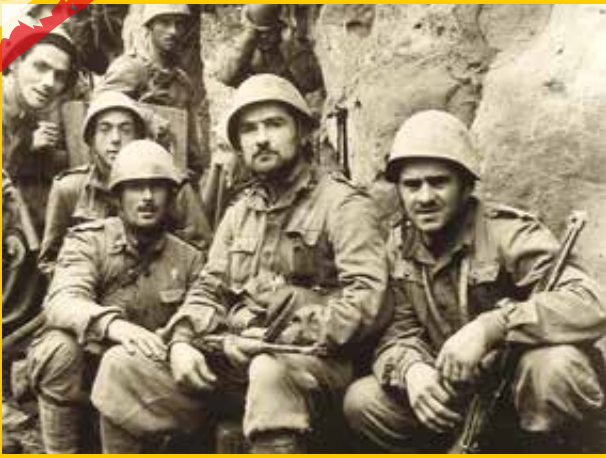
Fanti italiani prima dell'attacco a Montelungo