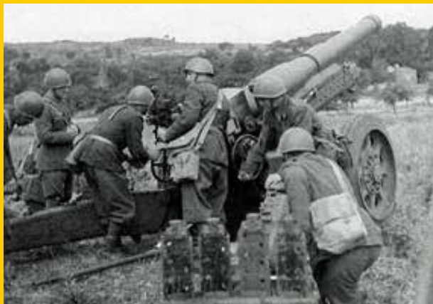
Artiglieri in Sardegna 1943

Dal 12 al 18 il battaglione AUC si scontrò ancora coi tedeschi a Nord di Bari (12 S. Spirito, 13-16 Trani, 18 Cassano delle Murge). Sarà poi uno dei reparti che si coprirà di gloria nella battaglia di Montelungo con il 1° Raggruppamento Motorizzato.