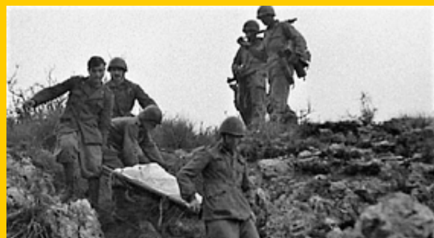
Monte Lungo, Recupero salme