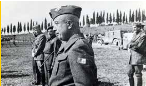
Il Generale Umberto Utili